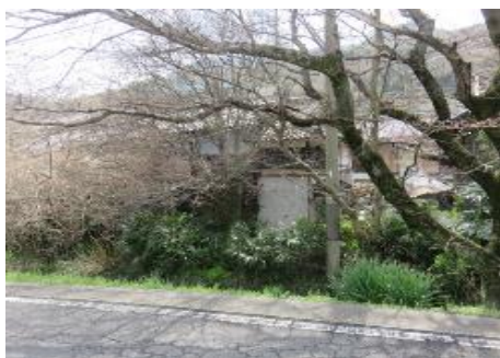
北側道路から見て左側