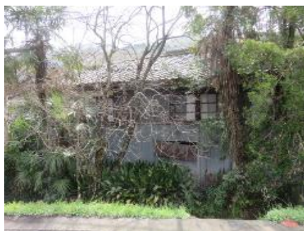
北側道路から見て右側